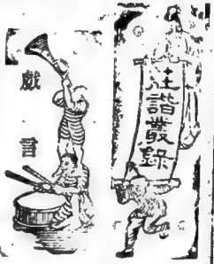
華盛頓孔子武王合傳 (丹新)